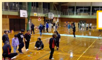
ニュースポーツ交流会

呉羽地区スポーツ協会は創立70周年という節目を迎えました。地域に根ざした活動を大切に、7種目の大会開催をはじめニュースポーツなどの交流会を3回行い、多くの住民の方々と一緒にスポーツを楽しんでいます。スポーツを通じて生まれる笑顔や交流は健康づくりだけでなく新たな仲間との出会いや、心の豊かさも育んでくれます。今後もスポーツの力で世代を超え誰もが参加でき、心も体も元気になれる場所を広げ、住民の方々と共に楽しんでいきたいです。