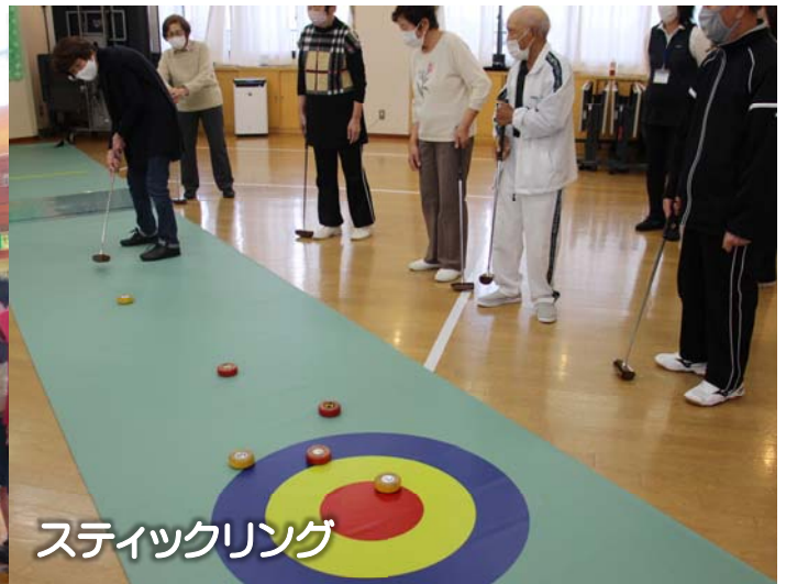
スティックリング