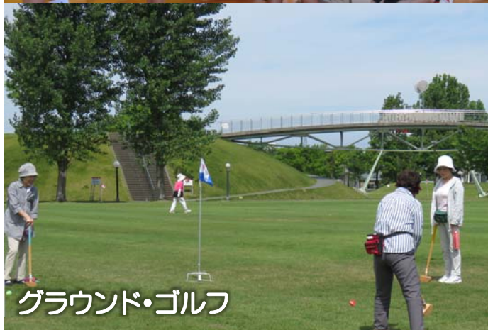
グラウンド・ゴルフ