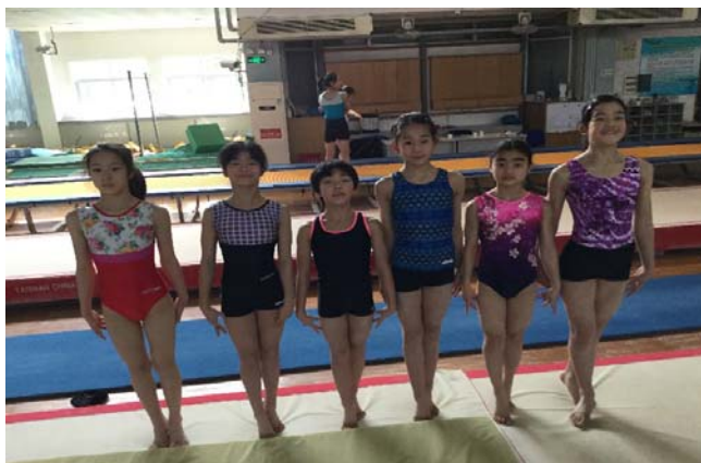
(富山市ジュニア特別強化遠征事業 中国 上海市にて)