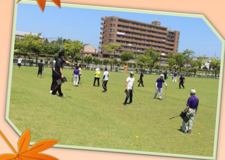
ニュースポーツ体験会