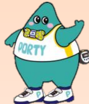
体協マスコットぼーてい