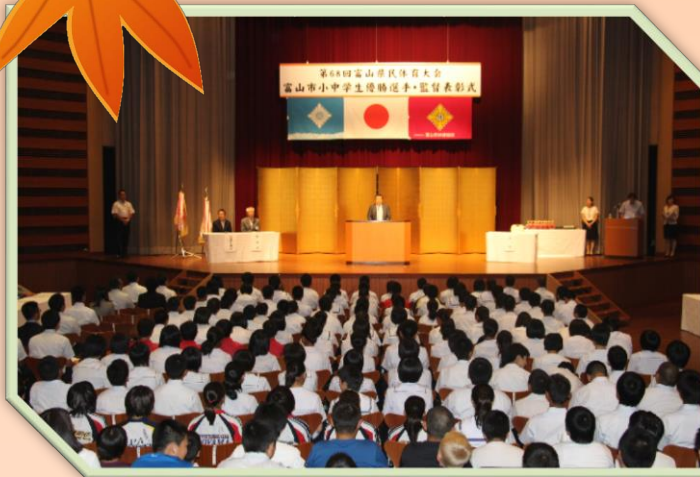
第68回富山県民体育大会 小中学生優勝選手及び監督表彰式