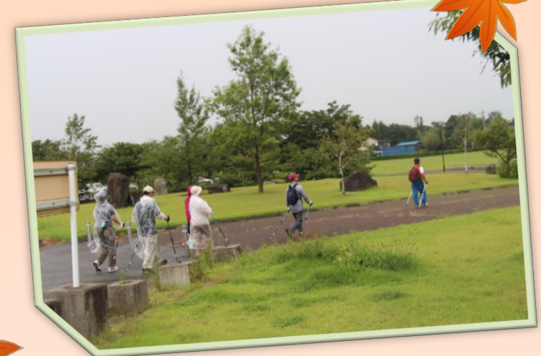
ウォーキングセミナー講習会 ～ノルディックウォーク編～