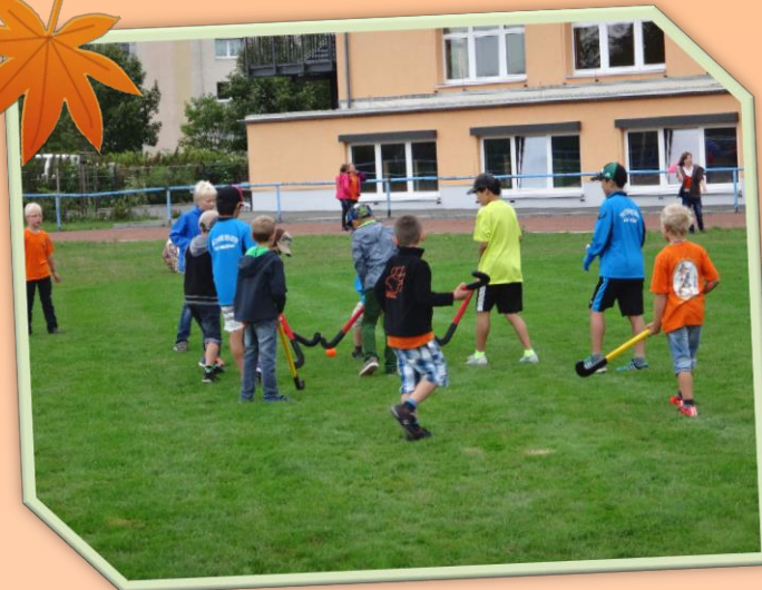
スポーツキッズ国際交流事業