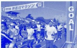
▲自分の記録に挑戦!!