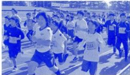
◀元気がいっぱい笑顔で走る子どもたち