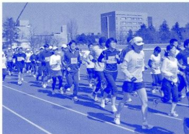
▲スタート後、一斉に走り出すランナー