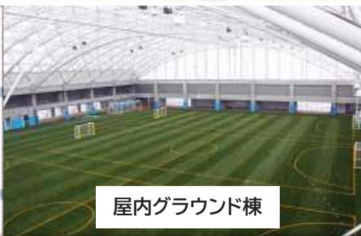
屋内グラウンド棟