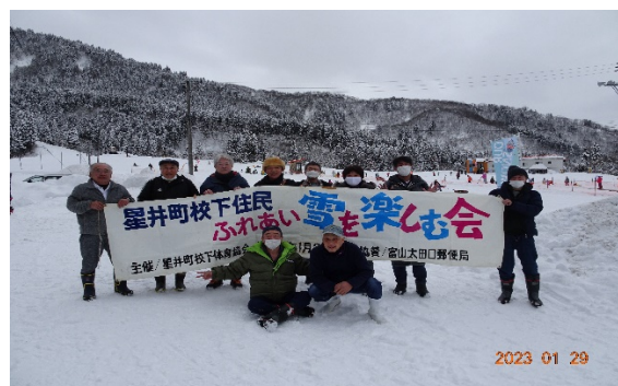
雪を楽しむ会 (粟巣野スキー場)