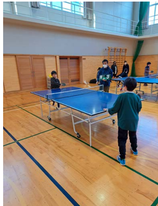
2月5日 卓球大会 (小学生交流大会)