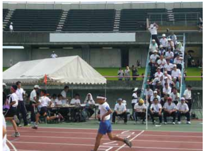
猛暑の中、計測する役員（連合運動会）

25m完泳者の割合は、学年によって違いはあるが、3.4～12.1ポイント向上した。特に、4年生（前年度3年生）では、前年比で、12.1ポイントという著しい伸びが見られ、泳力向上事業の効果が表れていると考えることができ、来年度の結果が期待されるところである。