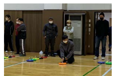
(11・10 ニュースポーツ体験会)