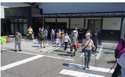
(9・11 健康づくりウォーキング)