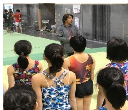
(富山市特別強化アドバイザー事業にて)

今後も、協会一丸となりジュニア層の競技力の向上や若い指導者の育成・強化に努めたいと思います。