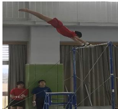
(富山市ジュニア特別強化遠征事業 静岡産業大学にて)