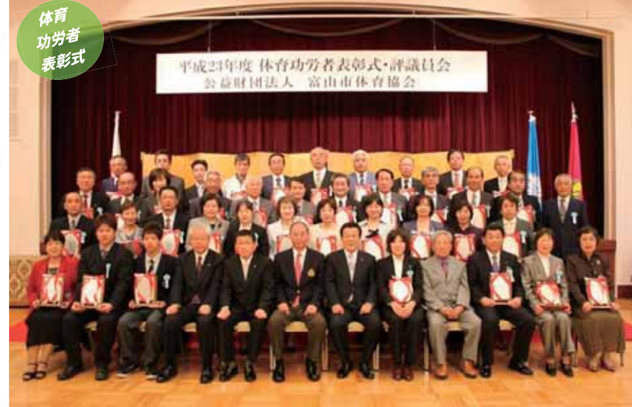
体育功労者表彰式