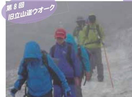
第8回旧立山道ウォーク

第8回を迎えた旧立山道ウォークは、曇り空でスタートし、雨・霧・強風という悪天候で自然に左右される行程となりました。最終日には強風のため一の越より引き返すことになり、登拜することはできなかったものの、全日程を完歩し、出迎えに来た家族と笑顔がこぼれていました。