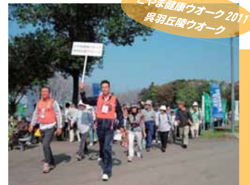
とやま健康ウォーク 2011・呉羽丘陵ウォーク

第8回を迎えた旧立山道ウォークは、曇り空でスタートし、雨・霧・強風という悪天候で自然に左右される行程となりました。最終日には強風のため一の越より引き返すことになり、登拜することはできなかったものの、全日程を完歩し、出迎えに来た家族と笑顔がこぼれていました。