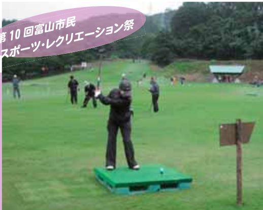
第10回富山市民スポーツ・レクリエーション祭

パークゴルフ大会は、猿倉山森林公園芝生広場を会場に、あいにくの小雨模様ではありましたが、参加者の皆様は1打1打集中してゲームを楽しみました。