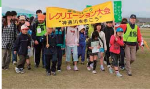
健康ウォーク 2011・レクリエーション大会とやま

4月29日(昭和の日)に、参加者約1200名が春を感じる神通川河川敷で、5kmと7kmの2コースに分かれてウォーキングし、さわやかな汗を流しました。